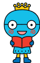
西宮市キャラクター みやたん