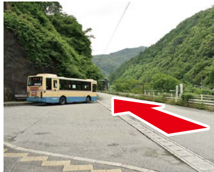
② 改札を出て左へ 川沿いの道を進む