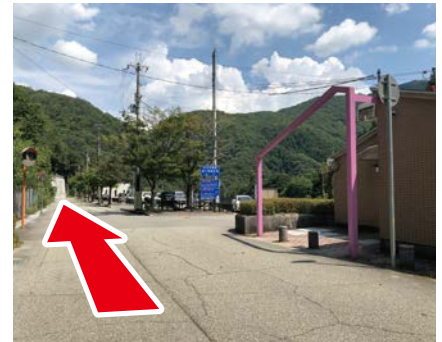
③ 右手にトイレ まっすぐ進む