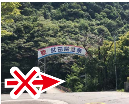
④ 右の橋は渡らない 右手奥の橋は渡らない