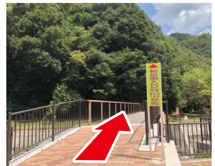
⑥ 桜の園入口看板 右手に見える看板の先が 廃線敷です