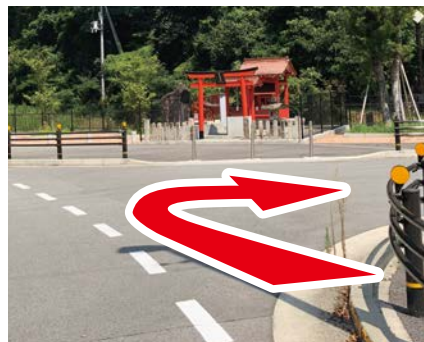
⑤ 神社を右折 小さな神社を右折