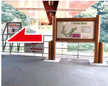
① 駅前案内看板 廃線敷へのマップがあります