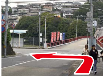
② 渡らずに手前を左 道路を赤い橋方向に渡ると 歩道がないので、左へ進む