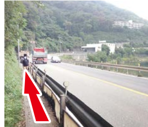
③ 歩道が狭い、注意 歩道が狭いので一人ず つ進むのがやっとです