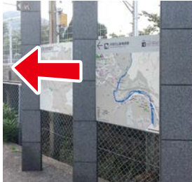
① 駅前案内看板 廃線敷へのマップが あります