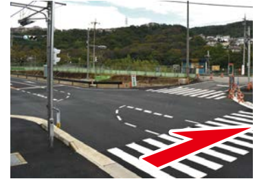
④ バス停前の横断歩道 木ノ元バス停前の横断歩道 を渡る