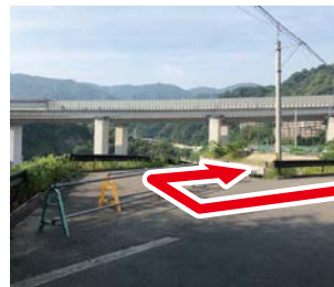
⑦ 右折 簡易トイレの見える方 へ右に降りて行く