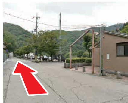
③ 右手にトイレ まっすぐ進む