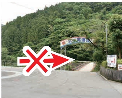
④ 右の橋は渡らない 右手奥の橋は渡らない