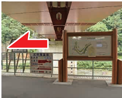
① 駅前案内看板 廃線敷へのマップがあります