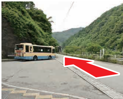
② 改札を出て左へ 川沿いの道を進む