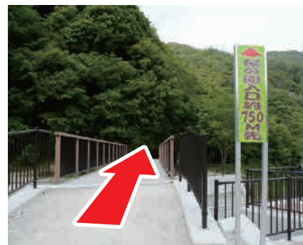
⑥ 桜の園入口看板 左手に見える看板の先が 廃線敷です