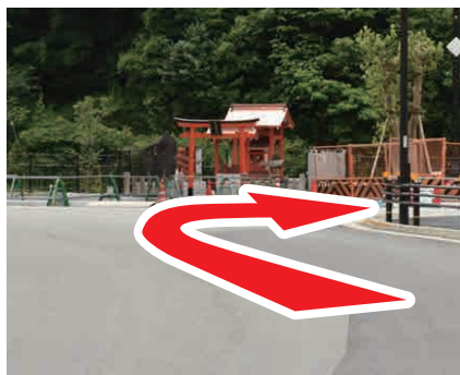
⑤ 神社を右折 小さな神社を右折