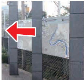
① 駅前案内看板 廃線敷へのマップが あります