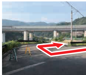
⑦ 右折 簡易トイレの見える方 へ右に降りて行く