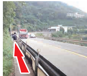
③ 歩道が狭い、注意 歩道が狭いので一人ず つ進むのがやっとです