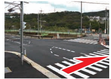
④ バス停前の横断歩道 木ノ元バス停前の横断歩道 を渡る