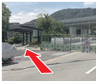
⑥ 道路案内に沿って 工事中につき、道路案内 に沿って進む