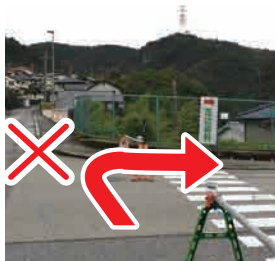
⑤ 右へ進む 前の橋は渡らずに、 道路沿いを右に進む