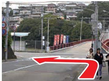
② 渡らずに手前を左 道路を赤い橋方向に渡ると 歩道がないので、左へ進む