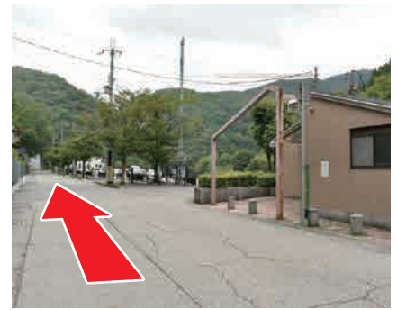
③ 右手にトイレ まっすぐ進む