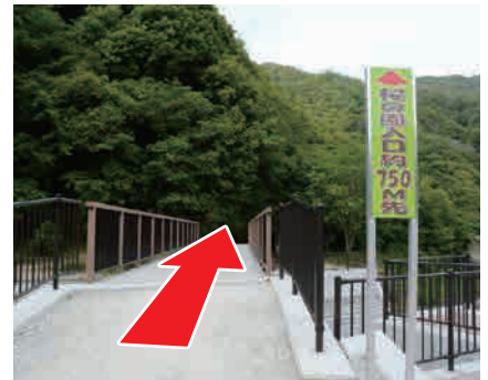
⑥ 桜の園入口看板 左手に見える看板の先が 廃線敷です。