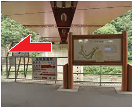
① 駅前案内看板 廃線敷へのマップがあります。