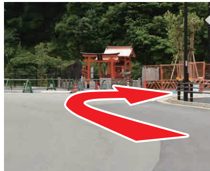
⑤ 神社を右折 小さな神社を右折