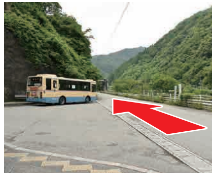
② 改札を出て左へ 川沿いの道を進む。