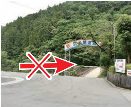
④ 右の橋は渡らない 右手奥の橋は渡らない