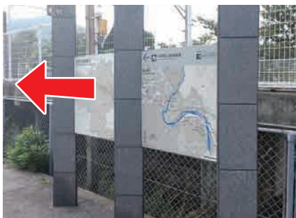
① 駅前案内看板 廃線敷へのマップがあります。