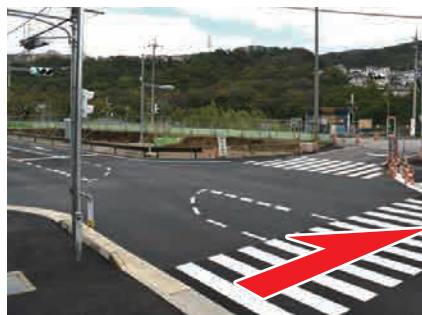
⑤ バス停前の横断歩道 木ノ元バス停前の横断歩道 を渡る。