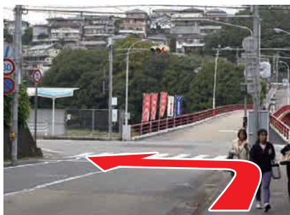
② 渡らずに手前を左 道路を赤い橋方向に渡ると歩道がないので、左へ進む