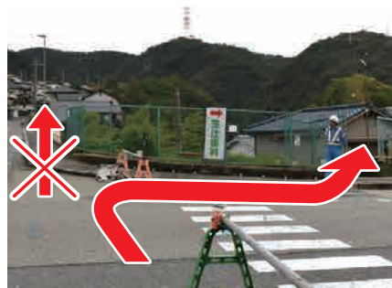
⑥ すぐ右の小道に入る 手前の橋を渡らずに、看板が あるすぐ右の小道に入る。