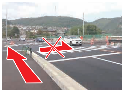
④ 渡らない横断歩道 交通量が多いので、渡らず、 前方の信号まで進む。