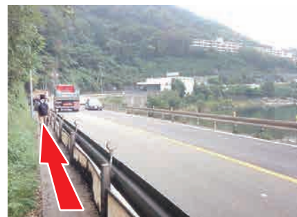
③ 歩道が狭いので注意 歩道が狭いので一人ずつ進むのがやっとです。