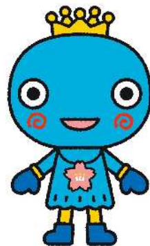
西宮市観光キャラクター 「みやたん」

日 時 平成 26 年 4 月 6 日 (日) 午前 10 時 ~ 午後 2 時 (雨天中止)