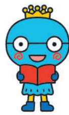
西宮市キャラクター みやたん