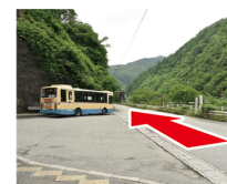
②改札を出て左へ 川沿いの道を進む