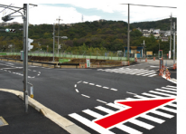
④バス停前の横断歩道 木ノ元バス停前の横断歩道を渡る