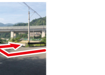
⑦右折 トイレの見える方へ右に降りて行く