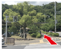
②ロータリーを渡る ロータリーを渡り、前の高架を左へのぼって行く