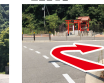
⑤神社を右折 小さな神社を右折