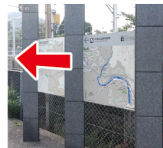
①駅前案内看板 鹿線敷へのマップがあります