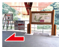
①駅前案内看板 鹿線敷へのマップがあります