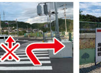
⑤右へ進む 前の橋は渡らずに、道路沿いを右に進む