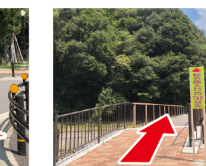
⑥桜の園入口看板 右手に見える看板の先が鹿線敷です