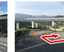
⑥右折 簡易トイレの見える方へ右に降りて行く