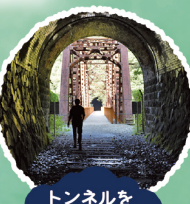
トンネルをくぐると