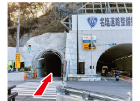
③トンネルに入る 横断歩道を渡り、左側の歩行者用トンネルに入る