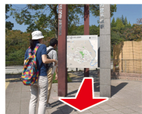
①駅前案内看板 看板を見て手前側へ進む