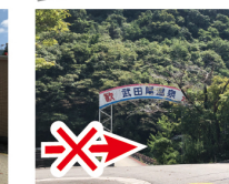
④右の橋は渡らない 右手奥の橋は渡らない