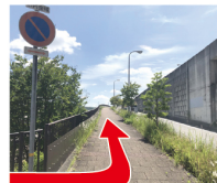
③国道176号を進む 国道176号沿いの歩道を進む