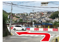
②渡らずに手前を左 道路を川側に渡ると歩道がないので、左へ進む