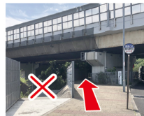
④高速の下を通る 左の坂は降りずにまっすぐこの前後から見える町並みは撮影ポイント