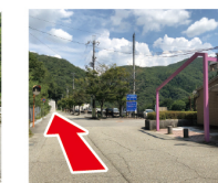
③右手にトイレ まっすぐ進む