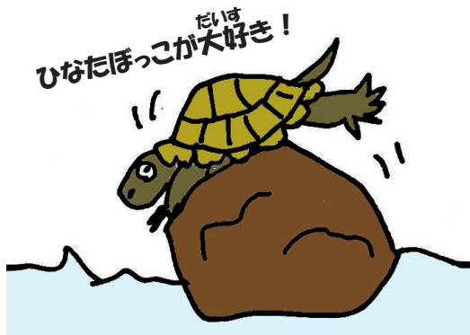
たいは ひなたぼっこが大好き！