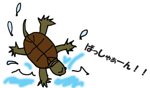
ひと 人がちかづく と みず なか すぐに水の中へにげる はずかしがいや なんだ ！

にほん 日本にむかしからいるカメだよ。 いま、 すく なかまが少なくなっているんだ だいじにしてね！