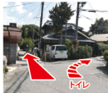
⑤ 分岐 直進が廃線敷、右へ進むと簡易トイレ。