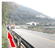
③ 歩道が狭い注意 歩道が狭いので一人ずつ進むのがやっとなです。