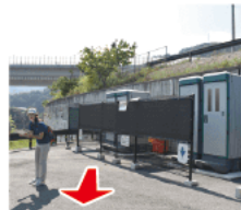
⑥ 簡易トイレ ここから武田尾まではトイレはありません。