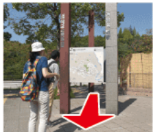
① 駅前案内看板 廃線敷へのマップがあります。