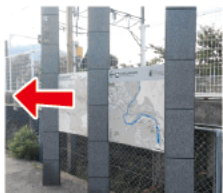
① 駅前案内看板 廃線敷へのマップがあります。