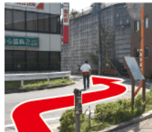
② 分岐 トイレ横を右側へ進む。