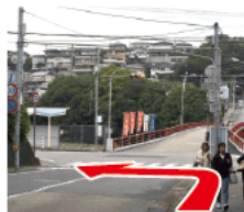
② 渡らずに手前を左道路を赤い橋方向に渡ると歩道がないので、左へ進む。