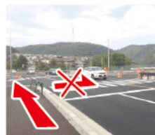
④ 渡らない横断歩道 交通量が多いので、渡らず、前方の信号まで進む。