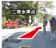
④ 分岐 左折せず、直進する。道沿いの二等水準点が目印