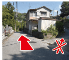
③ 分岐 墓地沿いに沿って直進する。