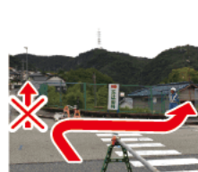
⑥ すぐ右の小道に入る 手前の橋を渡らずに、看板があるすぐ右の小道に入る。