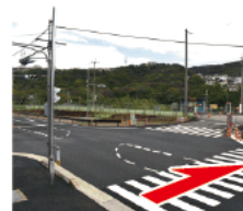
⑤ バス停の横断歩道 木ノ元バス停前の交差点の信号のある横断歩道を渡る。